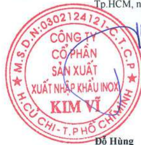
Đỗ Hùng Chủ tịch Hội Đồng Quản Trị