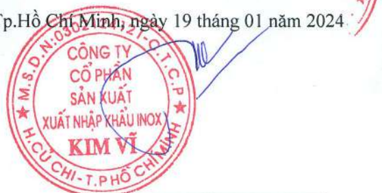
Đỗ Hùng Chủ tịch Hội Đồng Quản Trị